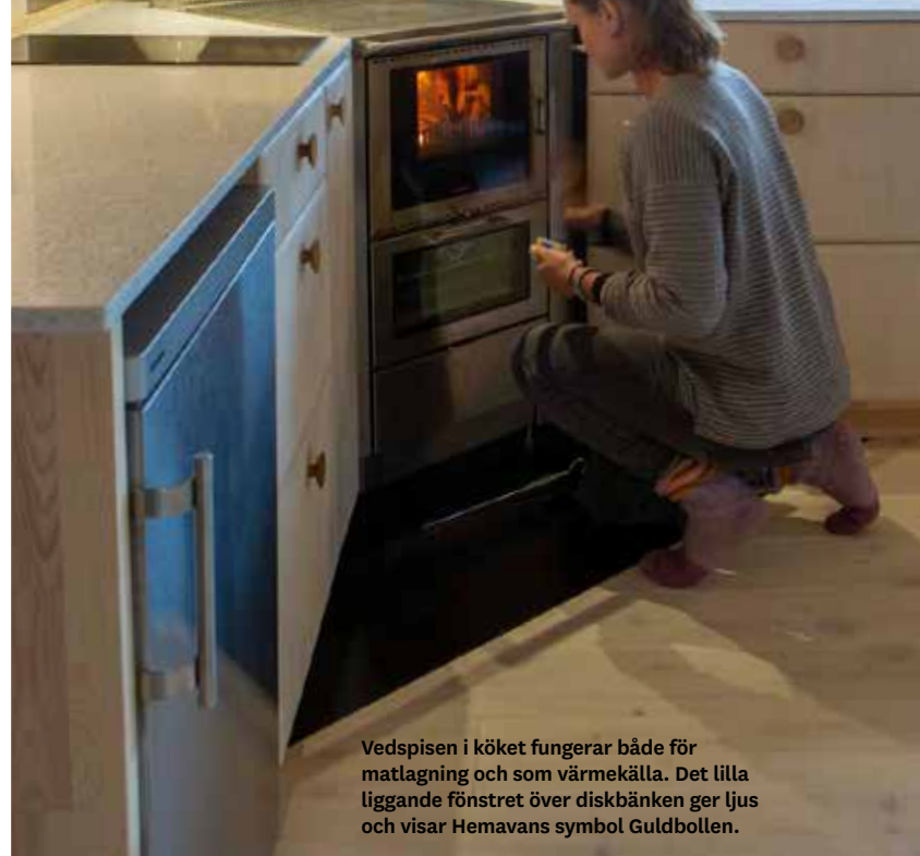
Vedspisen i köket fungerar både för matlagning och som värmekälla. Det lilla liggande fönstret över diskbänken ger ljus och visar Hemavans symbol Guldbollen.