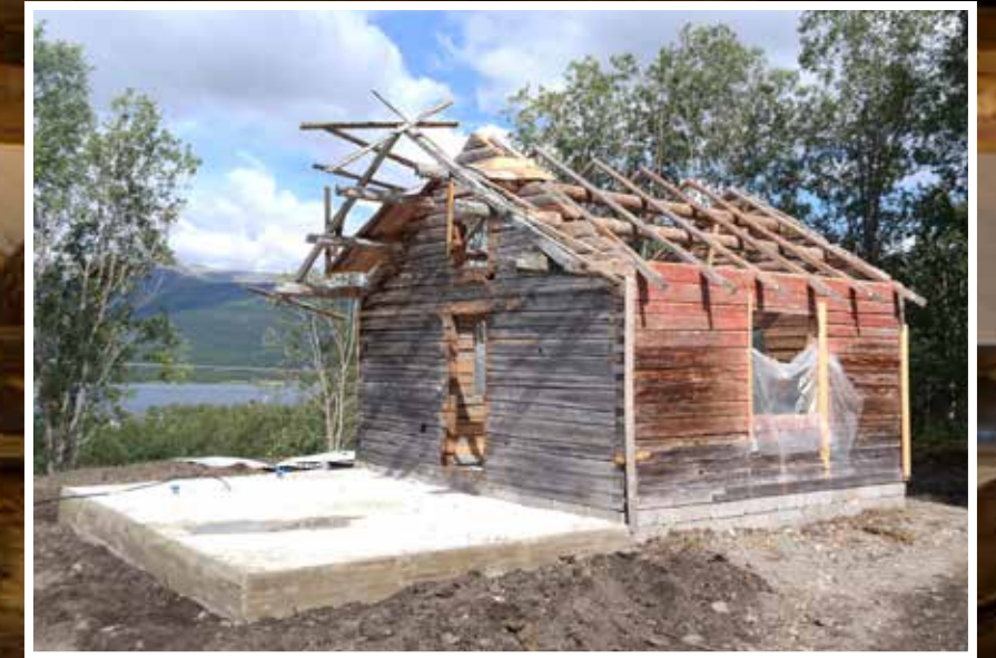
Storstugan är från början en timmerkoja som återuppbyggdes på tomten redan för fyrtio år sedan. Den gamla cementgrunden återanvändes för det nya bygget.

” Vyn över fjäll och sjö är vackrare än tavlor och ger dessutom ljusinsläpp.